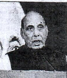
दिल्ली में नेशनल सिविलियरिटी समिट में बोलते रक्षा मंत्री राजनाथ सिंह।

नई दिल्ली, विशेष संवाददाता। रक्षा मंत्री राजनाथ सिंह ने कहा कि भारत ने अपनी शर्तों और स्वेच्छा से ऑपरेशन सिंदूर रोका था। भारत पाकिस्तान के खिलाफ लंबी लड़ाई के लिए पूरी तरह तैयार था। दिल्ली में गुरुवार को नेशनल सिविलियरिटी समिट 2.0 में उन्होंने ये बातें कहीं। रक्षा मंत्री ने पाक को आतंकवाद का अंतरराष्ट्रीय केंद्र बताते हुए आतंकवाद की वैचारिक व राजनीतिक जड़ों को खत्म करने पर जोर दिया। उन्होंने कहा कि भारत परमाणु हमले की धमकी में नहीं आया। ऑपरेशन सिंदूर को याद करते हुए उन्होंने कहा कि इस मिशन को लगभग एक साल हो गया है। ऑपरेशन ने पूरी दुनिया को संदेश दिया कि भारत अब पुरानी सोच वाला देश नहीं है, जहां हमारी धरती